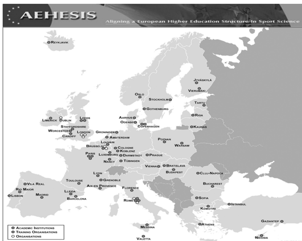
Ryc.1 Organizacje uczestniczące w projekcie AEHESIS

Od tego momentu, eksperci do spraw kształcenia kadr dla potrzeb sportu z 28 krajów europejskich, a dokładniej z 70 organizacji partnerskich (Ryc.1), odbyli szereg spotkań i konferencji. Ponadto w ramach korespondencji elektronicznej, wymienili między sobą liczne dokumenty i kwestionariusze.