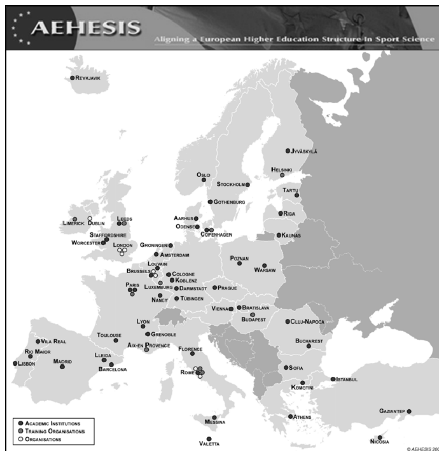
Figura 1: AEHESIS - Organizações Parceiras

O Projecto foi coordenado pelo "Institute of European Sport Development & Leisure Studies", da "German Sport University Cologne", com a chancela da "European Network of Sport Science, Education & Employment (ENSSEE)". O projecto é desenvolvido, com um "management group", um "expert group" e quatro "research groups" nas referidas áreas de especialidade da formação em Desporto, nomeadamente "Physical Education", "Sport Management", "Health & Fitness" e "Sport Coaching".