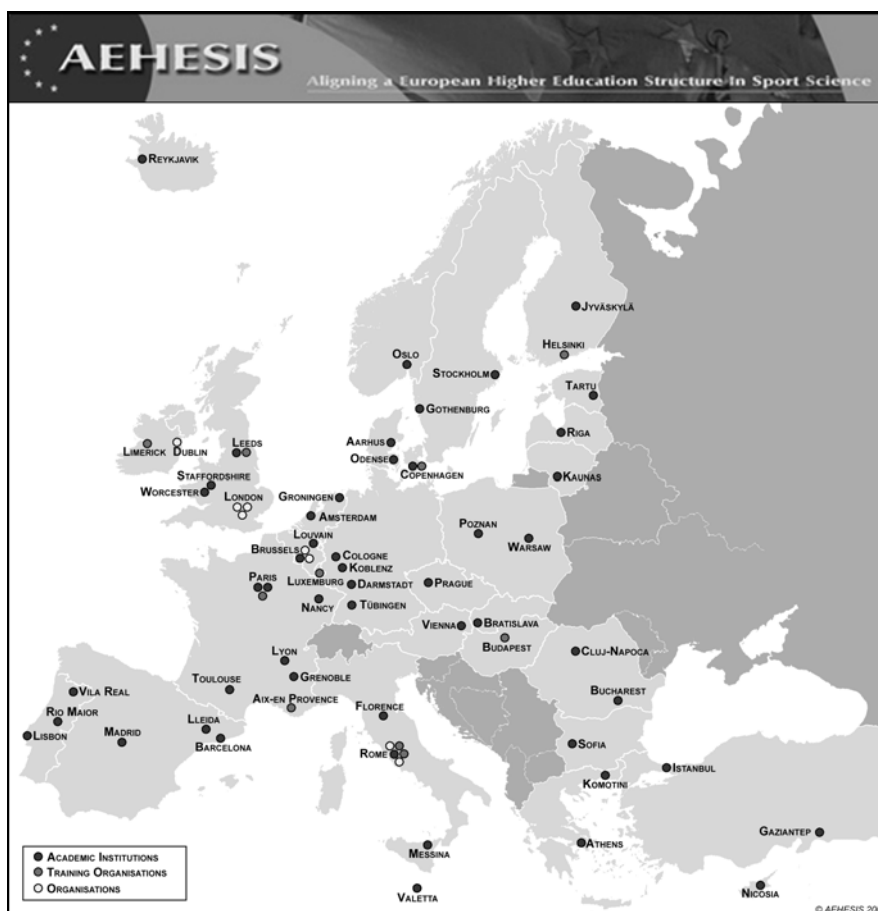
Figure 1: AEHESIS Partner Organisations

Projekt bol koordinovaný Institute of European Sport Development & Leisure na Nemeckej univerzite športu v Kolíne z poverenia European Network of Sport Science, Education & Employment (ENSSEE). Projekt viedla manažérska skupina, expertná skupina a štyri výskumné skupiny v určených úsekoch vzdelávania v športe, konkrétne v oblastiach telesnej výchovy, športového manažmentu, zdravia a fitnis a trénerstva projekt realizovali.