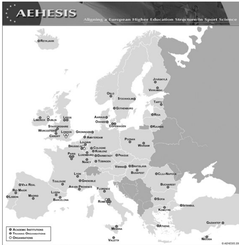
Şekil 1: AEHESIS Ortakları

Projenin yürütücüsü “Avrupa Spor Bilimleri, Eğitimi ve İstihdamı Birliği (ENSSEE)” adına Köln Alman Spor Üniversitesi bünyesindeki Avrupa Spor Gelişimi & Serbest Zaman Çalışmaları Enstitüsü'dür. Projenin sürdürülmesinde bir yönetim grubu, bir uzman grubu ve spor bilimleri eğitiminin yukarıda tanımlanan alanlarında dört araştırma grubu kurulmuştur.